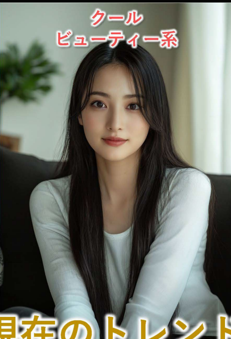
クール ビューティー系